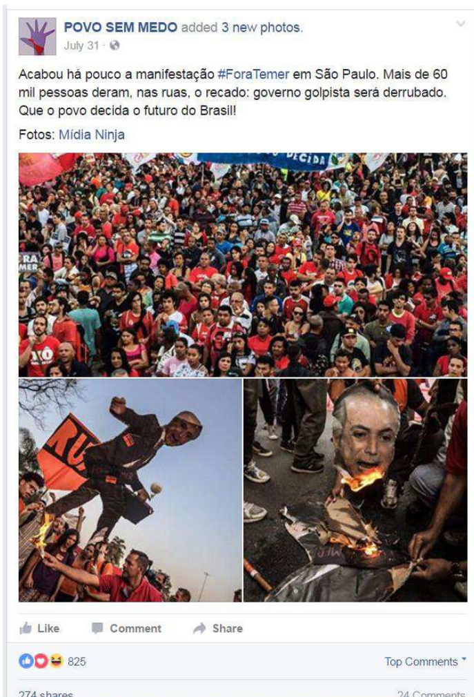
Figura 07. 8º post mais curtido, Povo Sem Medo