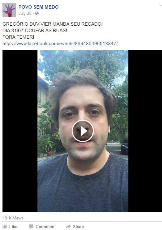
05. Post mais curtido, Povo Sem Medo

Com cerca 3,5 mil reações, um dos posts que teve maior impacto na rede social de esquerda analisada aqui foi o vídeo em que Gregório Duvivier convoca a população para a manifestação do dia 31.07.2016. Ademais, mais de 8 mil