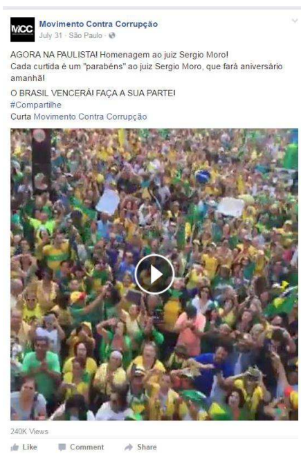
Figura 04. 6º post mais curtido, MCC

Por fim, observamos duas postagens que trazem registros das manifestações. A sétima postagem mais curtida, traz fotos de manifestantes vestidos de verde amarelo nas ruas de São Paulo. E a sexta, um vídeo feito de cima de um carro de som na avenida Paulista, acompanhado do texto: “AGORA NA PAULISTA! Homenagem ao juiz Sérgio Moro! Cada curtida é um "parabéns" ao juiz Sérgio Moro, que fará aniversário amanhã! O BRASIL VENCERÁ! FAÇA A SUA PARTE...”. Esse tipo de postagem instiga um afeto empático que denota a existência real do grupo e faz com que os fãs da página sintam-se ali representados.