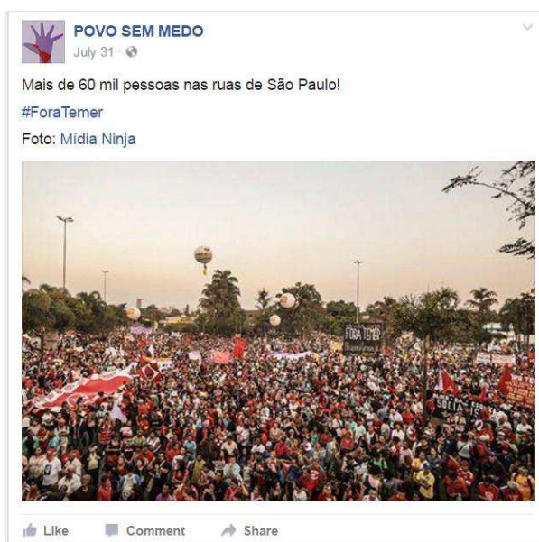
Figura 06. 4º post mais curtido, Povo Sem Medo

A seguinte postagem analisada é uma foto com os manifestantes já nas ruas, com o título "Mais de 60 mil pessoas nas ruas de São Paulo", a foto tirada da manifestação pela Mídia Ninja, busca instigar um afeto empático e que denote a potência e o discurso comum, de modo que as pessoas de esquerda que acompanham a página sintam-se representadas. Com pouca expressividade ao comparar com as postagens da página da direita, 1,6 mil reações essa postagem alcançou.