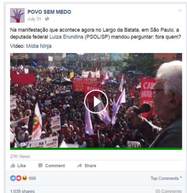
Figura 08. 10º post mais curtido, Povo Sem Medo

Por último, o post do dia da manifestação mais curtido em São Paulo, foi o vídeo em que a atual candidata a prefeitura Luiza Erundina discursa, apesar de sua relevância nesse cenário, o post não atingiu a marca de 700 reações, e dentre os comentários, os mais curtidos são os de oposição, que explicitam a dicotomia entre os vermelhos versus os verde e amarelo, os primeiros entendidos como inimigos a serem combatidos. Portanto, embora os grupos de oposição apresentem justificativas em relação ao post , eles não fogem as idéias inadequadas, pois se baseiam no discurso do ódio.